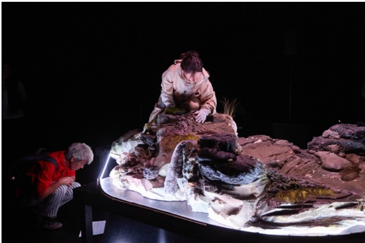
Szene aus «Plankton»