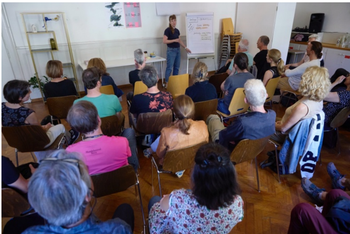
Erster Roundtable «Neue Musik Bern»