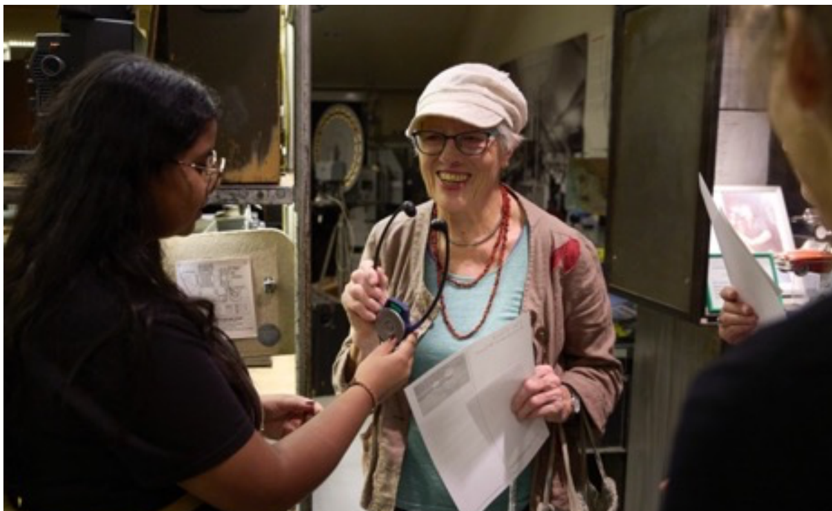
Ausgabe von Kopfhörern zur Nutzung der Audiodeskription zu «The Third Extended Wheel»

Für Menschen mit einer Sehbehinderung wurde das experimentelle Musiktheater «The Third Extended Wheel» mit Audiodeskription angeboten. Erfreuliche sieben Personen nutzten dieses Angebot. Die gleiche Zielgruppe wurde im Rahmen einer taktilen Führung eingeladen, Svetlana Marašs «Table Book» haptisch kennenzulernen und auszuprobieren.