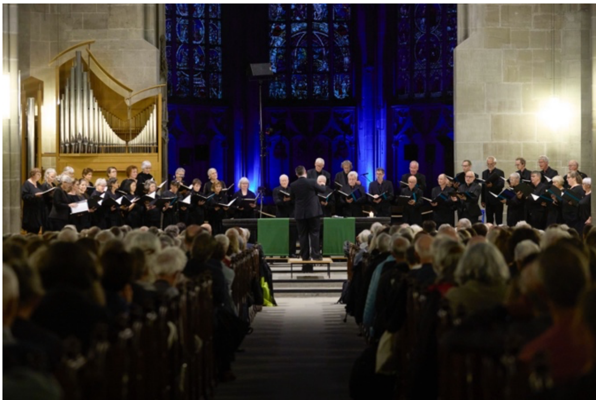
Publikumsmagnet «Zauber der Mehrhörigkeit»

Ein besonderer Publikumsmagnet war das Konzert «Zauber der Mehrhörigkeit» im Berner Münster, das alleine von mehr als 400 Personen besucht wurde.