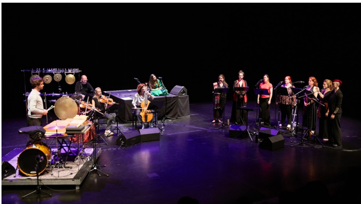
Das Ensemble Ictus und das Ensemble Irini bei der Performance von «The Book of Women»